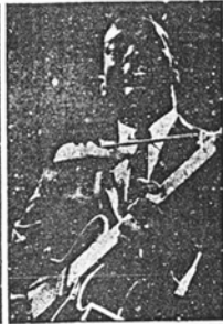
Ihre große Zeit hatten auch die Zupfinstrumente auf den diesjährigen Berliner Jazz-Tagen. Unsere Bilder zeigen von