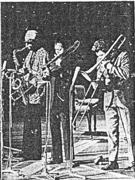
HOHEPUNKTE der beiden letzten Konzerte der diesjährigen Jazztage: Baden Powell, Brasiliens Meister-Gitarrist (links), und die Bläser der Archie-Shepp-Gruppe (Shepp mit Turlanmütze).